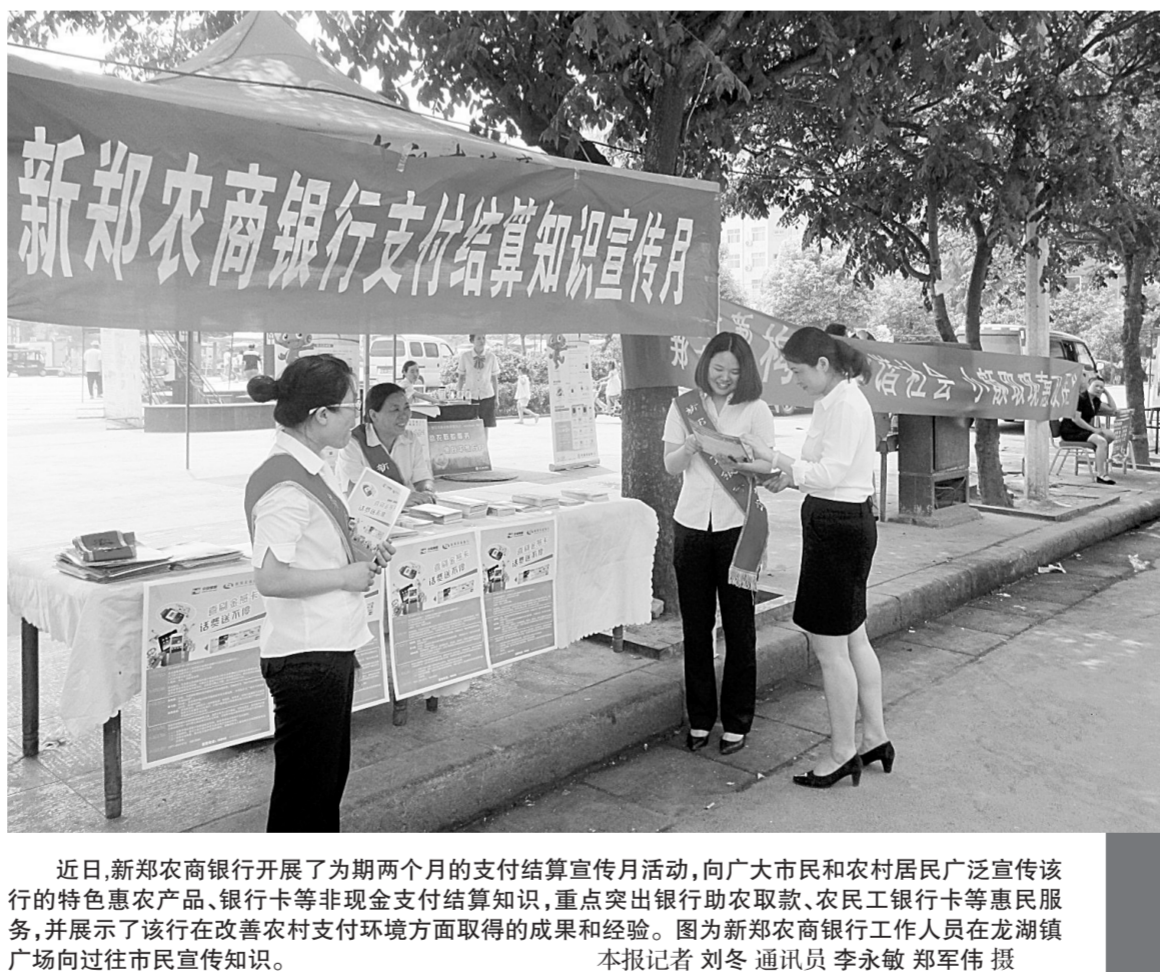
近日,新郑农商银行开展了为期两个月的支付结算宣传月活动,向广大市民和农村居民广泛宣传该行的特色惠农产品、银行卡等非现金支付结算知识,重点突出银行助农取款、农民工银行卡等惠民服务,并展示了该行在改善农村支付环境方面取得的成果和经验。图为新郑农商银行工作人员在龙湖镇广场向过往市民宣传知识。