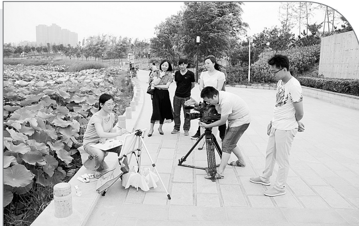
接天莲叶无穷碧，映日荷花别样红。眼下，正是荷花盛开的季节，新郑市轩辕湖湿地文化园吸引了不少摄影爱好者前来拍摄荷花，还有绘画爱好者现场写生。