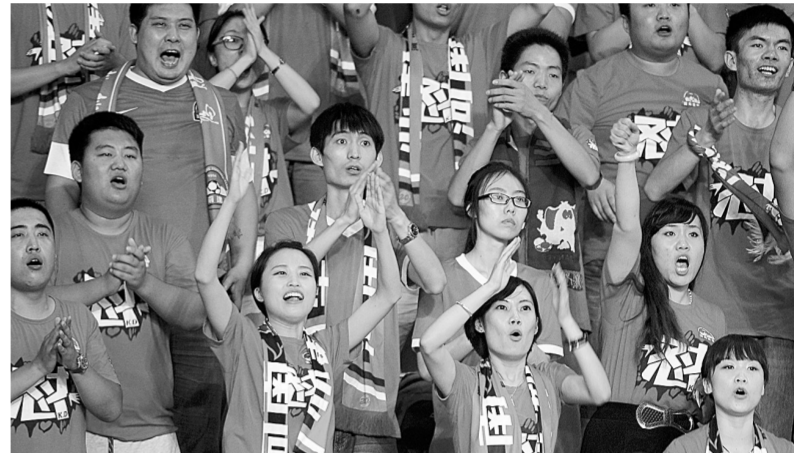
尽管不是周末,仍有16000名球迷涌入航海体育场为建业队呐喊助威。本报记者 唐强 摄