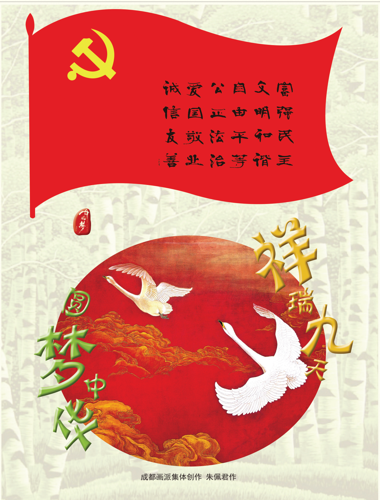
成都画派集体创作 朱佩君作