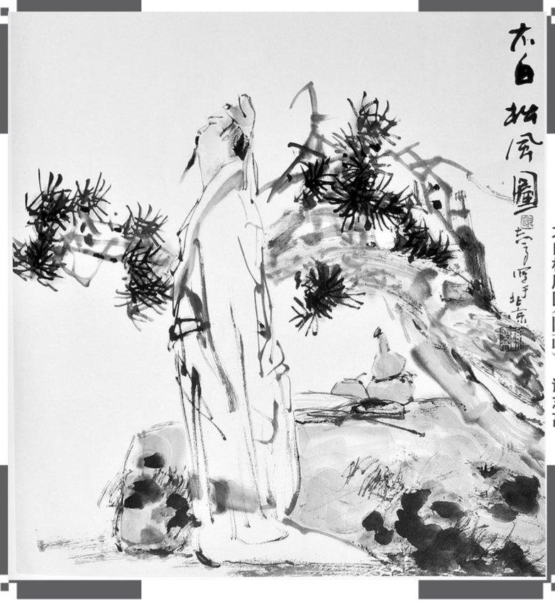
太白松风图(国画) 谢志高

笔者读《西游记》,对回目问题关注较多。人民文学出版社1955年和1980年有两次校本出版,回目多有修改,但也只是互参不同版本,从表意上考虑予以处理,或订正个别字词,“择其善者”而为之。并未注意对偶回目是否韵律和谐、对仗规范。以致现行的百回本回目,这方面问题仍不少。笔者仔细查验、逐回辨析,发现倒置的(前后两句平仄颠倒)回目约25回;双平的(两句末字均平声)回目11回;双仄的(两句末字均仄声)回目1回;对仗欠工,如字词或结构失对的回目约20回。失范回目总计超半数,是个不小的比例。这实际上也是考察其艺术水准的一个方面,更涉及文学名著的地位及读者的心理预期。