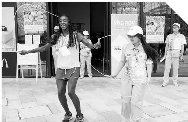
来自哥伦比亚的运动员斯科拉多(左)与志愿者一起跳舞。