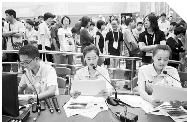
在射击赛场,志愿者分别承担法文、中文、英文播报员的工作。