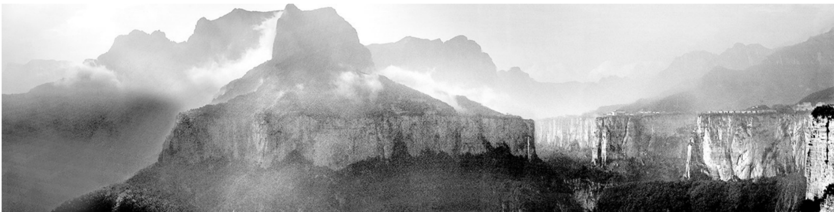
太行雨霁 清风知味 (摄影)

勤奋工作,为什么有助于健康长寿?因为人一一旦忙起来,可以刺激细胞,活跃心智,精力旺盛,物我两忘,身体各个系统处于相对平衡的状态,有利于人体远离疾病的侵袭,等于给人增加了营养。若您想健康长寿,那就使自己快快勤奋起来吧。