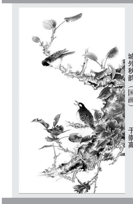
城外秋韵 (国画) 于崇高

他怎么都不肯相信自己的孩子会是差生。怎么可能呢? 自己的孩子小时候是一个多聪明的孩子啊! 唱歌他会,画画他会,弹琴他会,跳舞他也会,他还会说相声呢! 老师看出了他的疑惑,一脸严肃地说:“你说的这些,我都知道。你问问班里哪个小孩不会唱歌,不会画画,不会弹琴,不会跳舞。你再问问你的孩子,这次期末考试考了多少分? 上次期中考试考了多少分? 平时单元测验最多考过多少分?” 他当然不会问,尤其是当着这么多家长的面儿。况且,孩子也不在教室里。今天是一年级最后一次家长会,教室里全是家长,没有学生。他当着全班家长的面,如数家珍地给老师讲自己孩子小时候的聪明事儿,一桩桩、一件件,讲得滔滔不绝,讲得津津有味。 老师耐着性子听他说了半天,最后还是那句话:“你说的这些事,我都知道。你可问班里哪个小孩不会?” 老师还说:“你说的都是以前,不是现在。现在,你孩子的学习确实不怎么样!” 老师又说:“你还是赶快想想办法吧! 想办法提高一下你孩子的学习成绩,说别的都不重要。” 接着,老师讲了他的孩子在学校里的表现,每一件事都可以作为反驳他的话的证据,归根结底一句话:他的孩子不但是差生,而且是差生中的差生。家长会结束以后,一些家长围在他的身边,一个个愁眉不展,忧心忡忡。这些孩子都被老师宣布为差生。他们为自己的孩子找了许多优点,但却改变