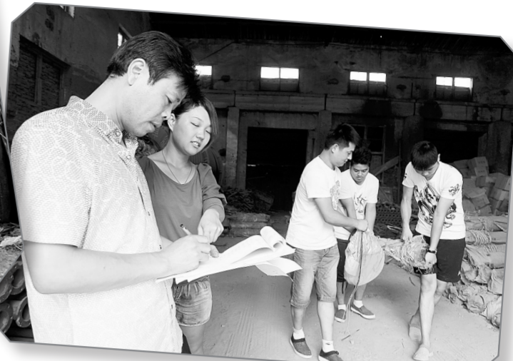
及时把抗旱设备送到最需要的地方。