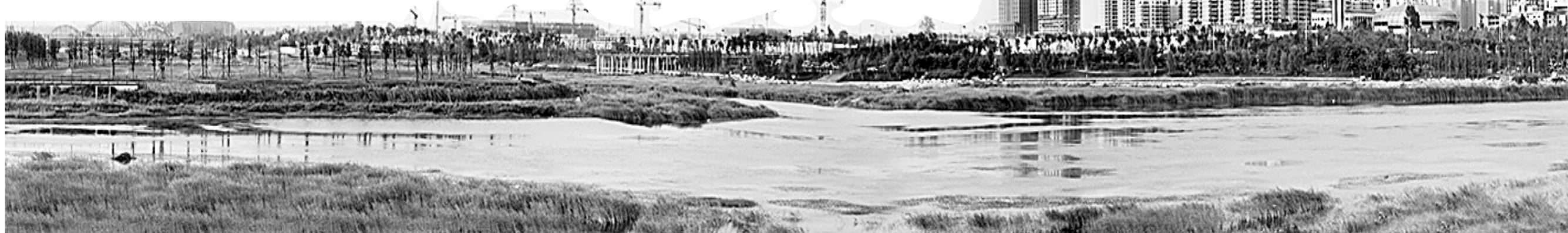
轩辕湖湿地文化园安静迷人。

从对水资源和水生态环境的重点保护到水土保持重点治理项目实施，从村村通自来水到农用机井升级改造，从小农水重点县建设到水库除险加固和一大批水利工程的实施……纵观今昔，新郑市农田水利基本建设已显现其生态效益、经济效益和社会效益，有力地推动了该市现代农业的发展和新型城镇化建设，在“美丽新郑”的恢宏画卷中书写了浓墨重彩的一笔。