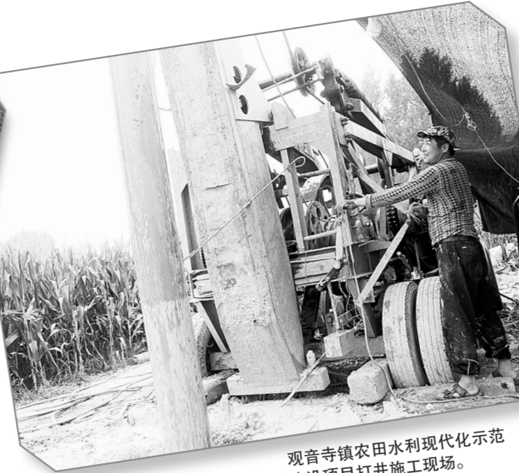
观音寺镇农田水利现代化示范乡镇建设项目打井施工现场。