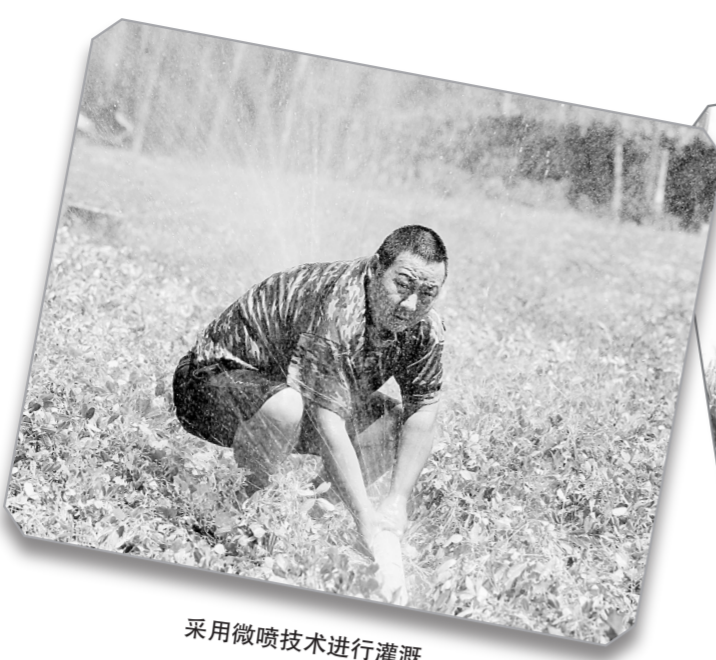
采用微喷技术进行灌溉。