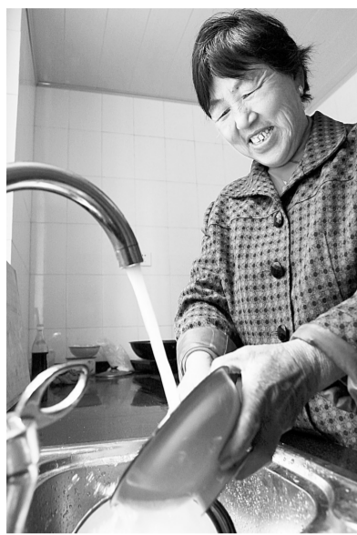
村民用上干净卫生的自来水。