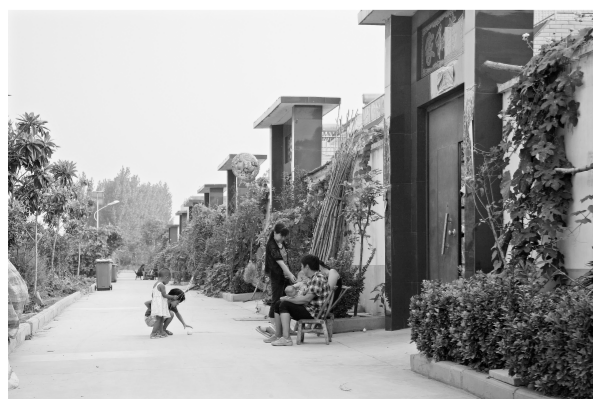
如今的寨杨村干净整洁,焕然一新。

本报讯(记者 史治国 通讯员 蒋士勋 李伟娜 文图)新修的水泥马路,错落有致的民房,干净整洁的小街……如今的荥阳市豫龙镇寨杨村焕然一新。寨杨村的变化,仅是荥阳市农村面貌改观的一个缩影。