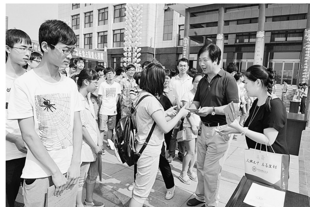
近日,登封市慈善总会举办2014“同献爱心共铸希望”阳光助学金发放仪式。361名符合救助条件的大学拿到了助学金。