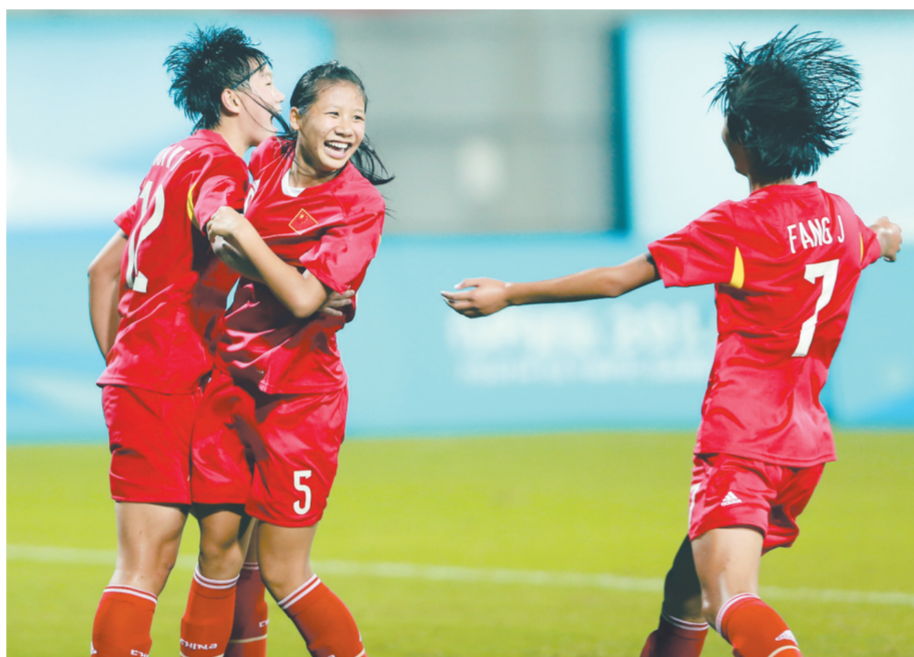
中国队球员庆祝进球。 新华社发