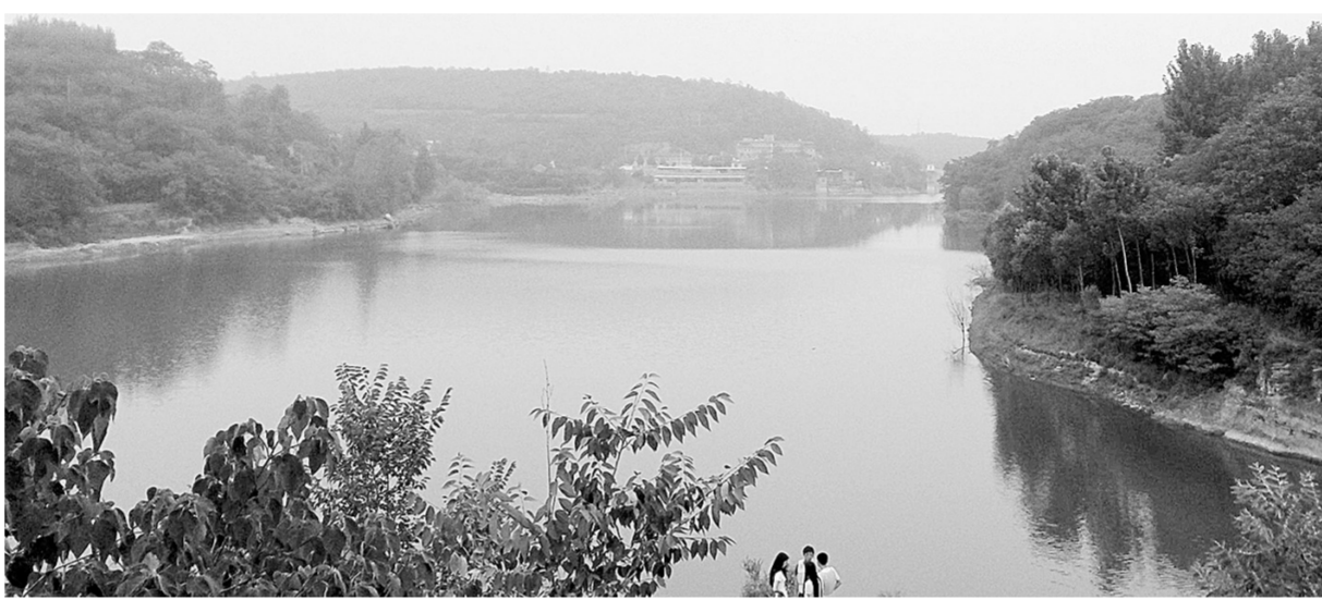
白龙庙村风光之美。

到过白龙庙村的人,都会被这里的清静与美丽打动。 群山环绕中,一池碧水倒映山林,泛舟水面,不时能看到水中的游鱼,远处,银白色的盘山公路犹如一条白龙,蜿蜒通向苍翠山林的深处……这里远离城市的喧嚣和工业的污染,山、水、树、空气,都是一样的纯净,置身于此,仿佛可以忘记一切烦恼,享受大自然带来的宁静与美丽。