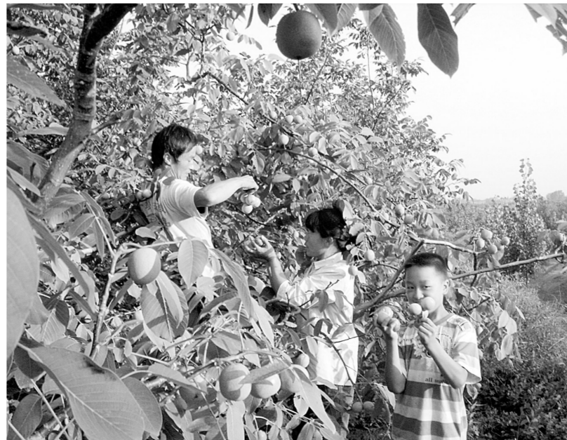
农民正在采摘核桃。

初秋时节,郑州街头已可见售卖新鲜核桃的摊贩。作为核桃的主产地登封,大旱之年收成怎样?昨日,记者前往核桃集中种植地颍阳镇走了一遭。