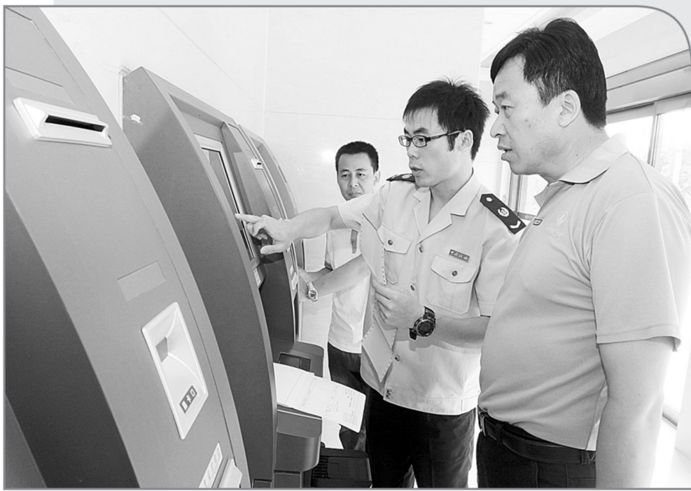
近日,新郑国税24小时办税服务厅正式启用,该自助办税服务厅集发票验旧发售、认证、申报等七大功能于一体,可为纳税人提供24小时自助申报、自助缴税、自助查询等服务。

学梦想,8月以来,登封团市委积极争取市青基会的支持,在全市范围内开展了“希望工程”圆梦行动。共资助大学新生27名,资助金额13.5万元。推荐该市9名贫困学子到郑州、南京、三亚等地职校学习,享受免学费、免食宿的两年职业教育。为全市20名贫困小学生发放了助学金,并承诺资助到小学毕业。