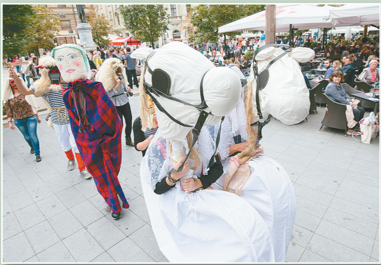
9月13日,在克罗地亚首都萨格勒布,人们参加木偶游行。第47届国际木偶节将于15日在萨格勒布开幕,来自9个国家的木偶剧团将参加此次为期5天的活动。