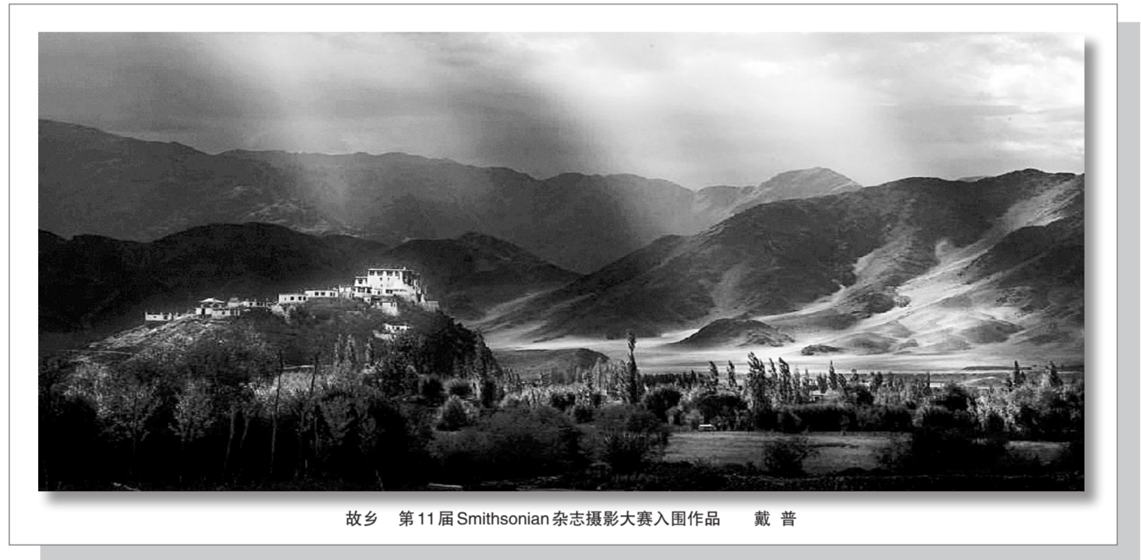
故乡 第11届Smithsonian杂志摄影大赛入围作品 戴普

京襄城遗址生态园地处村头,场地广阔,交通便利,往北不足3公里是贯穿东西的中原西路,往南1.5公里是正在修建中的陇海西路。