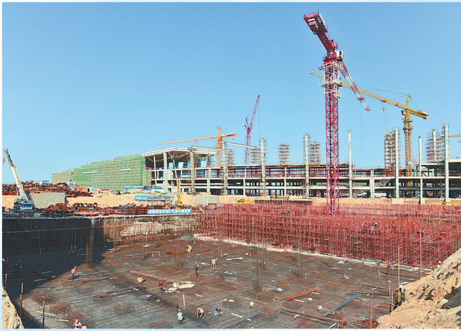
郑州机场二期扩建项目正在如火如荼建设中。

据了解,郑州机场二期工程项目设计旅客吞吐量2900万人次/年、货邮吞吐量50万吨/年、飞机起降量23.6万架次/年。项目占地8587亩,其中重点项目为T2航站楼,建筑面积40余万平方米,设计高度107米,比现有T1航站楼大3倍,计划于2015年建成。该航站楼是未来机场航站楼的主体,将与T1航站楼和远期规划的T3航站楼相连,方便旅客进出港。截至目前,该航站楼建设已完成总工程量的60%左右,从明年1月起,项目建设将转入内部装修及设备安装阶段。