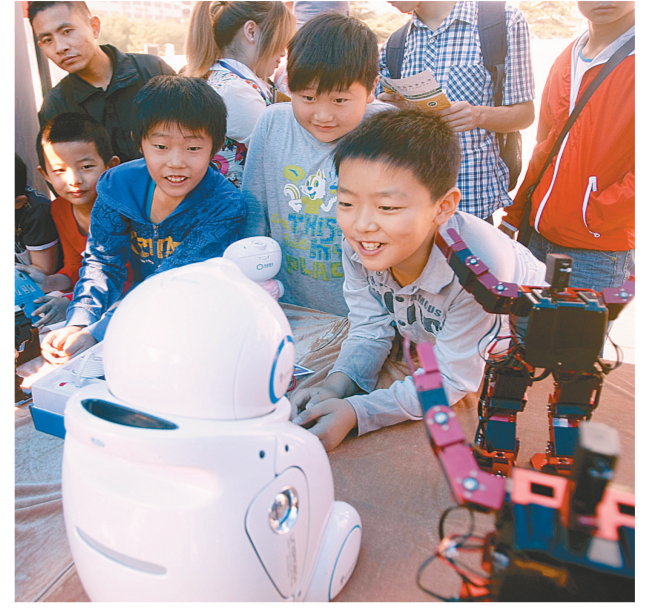
昨日上午,河南省全国科普日活动开幕。机器人表演吸引众多关注目光。