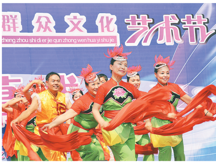
昨日上午,郑州市第二届群众文化艺术节拉开帷幕,文艺爱好者载歌载舞,尽情讴歌幸福生活。

市委宣传部分头主办的郑州市群众文化艺术节是市直宣传思想文化系统各单位、各县(市)区、各开发区共同参与的一项突出群众、演群众、看群众,充分发挥群众参与文化活动的积极性、主动性和创造性的大型群众文化活动,每两年举行一届。2012年首届群众文化艺术节举办的各类文化活动达600余场次,参与演出演员近2万人次,吸引社区、村镇居民60多万人次参与活动。