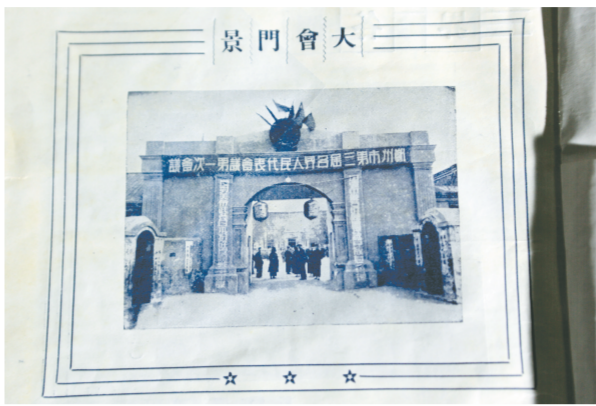
人民自主 开创历史