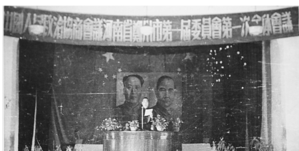
政治协商 书写辉煌