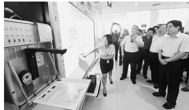
参观威科姆国际软件生态园

州城市综合交通体系建设规划和布局，审计署驻郑办的一位同志说，郑州近年来城市路网发展很快，成绩斐然，但是老城区的拥堵问题依然严重，从国内许多大城市交通状况来看，拥堵是城市发展的顽疾，交通道路建设速度远远赶不上人口和机动车增长速度，郑州应该认真研究城市面积、空间与人口、生活工作设施建设的合理比例，科技规划调节城市的“容积率”，才有可能从根本上破解包括交通在内的“城市病”。