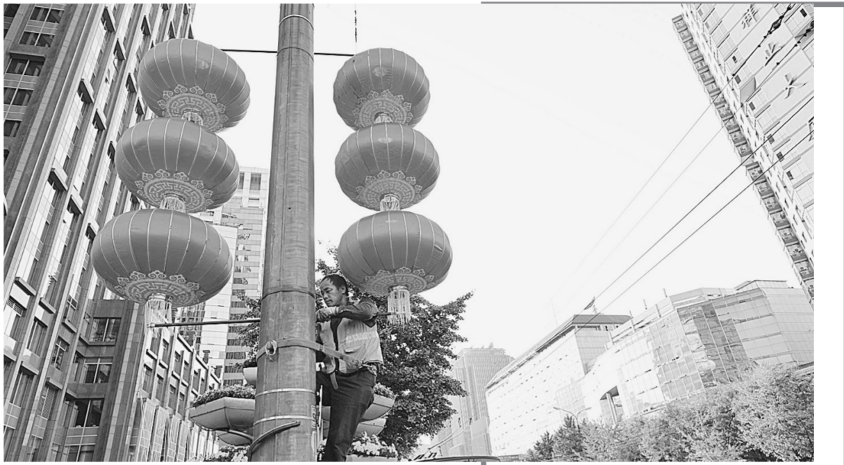
9月24日,一位工人在北京朝阳门外大街街边安装红灯笼。国庆节临近,北京街头张灯结彩。

雷希颖说,活动有这样的反响让人感到鼓舞。这也从侧面反映出,网络舆论呈现出的部分消极现象不能代表主流民意。默默爱着我们祖国的人们,才是中国社会的主流所在,而这种情感是最真实的,最有力的,最热烈的。