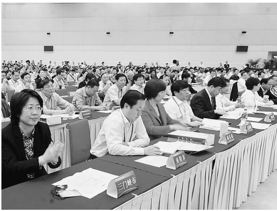
昨日,2014年河南省现代服务业开放合作洽谈会举行。

未来,我市市民休闲娱乐将有更多去处。开元城市发展(西安)投资管理有限公司,投资200亿元在管城区建设开元塔湾古街·“少林开元盛世”文化产业园项目,该项目将按照世界级文化旅游名镇、国家级文化重点项目的标准进行打造,以禅宗文化、中原文化为核心,融生态旅游、度假休闲、禅修体验、康体养生、观光农业等业态为一体的5A级旅游度假区,项目一期计划投资12亿元;由河南竹桂园旅游控股有限公司投资33亿元,在新密市建设柏崖山风景区,利用平陌当地经济资源、人文资源和秀美的自然风光,结合乙方的商业化运作,将平陌镇南部山区打造成国家4A级旅游景区。