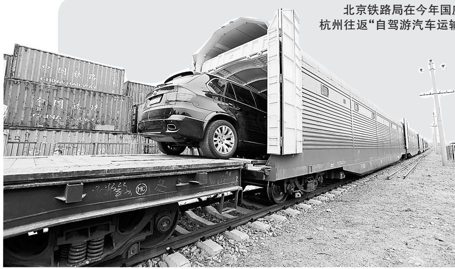
北京铁路局在今年国庆假期将首次开行北京至杭州往返“自驾游汽车运输班列”,并辅以动车组旅行运输专列。届时,旅客可乘坐动车组,汽车由铁路提供运输班列,分别到达目的地。这是国内开行的首条客运和汽车运输捆绑线路。截至目前,已有50余辆汽车办理完手续,陆续装车。图为9月28日,工作人员在北京装运汽车。