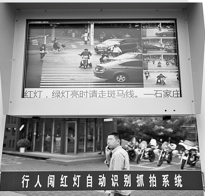
红灯,绿灯亮时请走斑马线。—石家庄