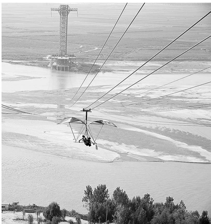
“十一”期间,不少游客带着孩子来到荥阳孤柏渡飞黄旅游区骑骆驼,滑索道,体验独特的黄河风情。据统计,该景区长假游客接待量达十余万人次。