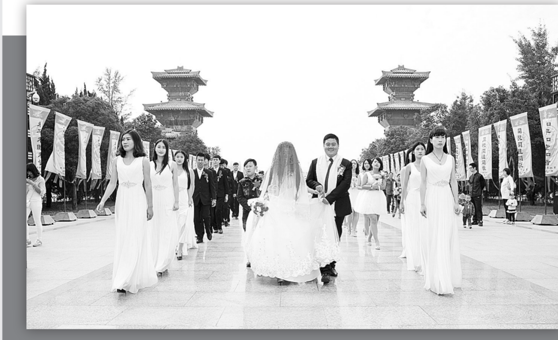
国庆节当天上午,一对新人选择到黄帝故里景区举行新婚拜祖仪式,吸引了不少游客驻足观看。新郎介绍说,在黄帝故里拜祖成婚,一是敬奉祖先,二是庆祝国庆,感觉特别有意义,永生难忘。

近年来,生活在大山深处的人们不知不觉中爱上了摄影,买相机,拍照片,投稿获奖已成为山区农民新的生活时尚。为满足山区农民学摄影、拍照片,赶时髦的愿望,景区管委会从人力物力财力等方面给予了大力支持。