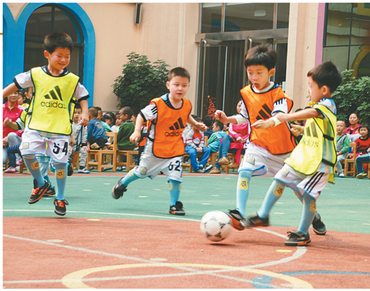
昨日,金水区第一幼儿园的小朋友们在进行足球训练。近日,市足球协会将“郑州市幼儿足球训练基地”的牌子授予该园,这是我市首个幼儿足球训练基地。

据交警三大队负责人介绍,市民普遍反映一些大型商场、医院周边路段违法停车现象较突出的问题,交警部门除了采取贴罚单和拖移车辆的治理举措以外,这次组织志愿者对乱停车进行劝阻,也是一种破解治理难的尝试。