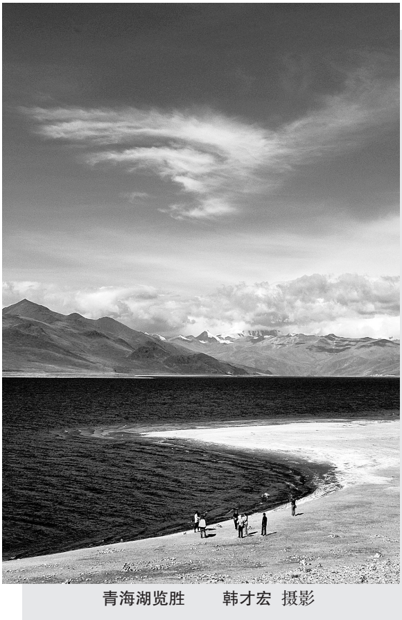
青海湖览胜