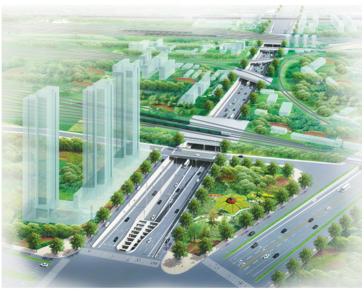
黄河路下穿北编组站隧道工程效果图

本报讯(记者 张倩)昨日,记者从黄河路下穿北编组站隧道工程建设指挥部了解到,该工程的箱涵架空顶进工作将于本月底完成,这标志着黄河路从沙口路至嵩山路下穿铁路段将全部打通。整个项目预计年底前建成通车,届时,黄河路从东至西,可直通嵩山路。