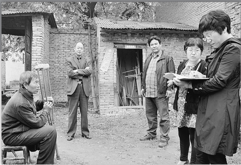
鲁庄镇机关干部、村干部深入贫困户、残疾人家中了解情况,帮助解决实际困难。

经过半年多的努力,30多项“民生微实事”大部分得以解决:关帝庙村蓄水池漏水,影响群众吃水安全,镇里对蓄水池进行修复,花了1.5万;桑家沟村五组生产道路被雨水冲坏,坑洼不平,镇里组织机械对道路进行了平整,花了7000元;南侯村排水渠排水不畅,下雨积水,镇村合力进行整改,花了3万元……用电方便了,吃水安全了,出行平坦了,排水通畅了,看着身边一点点细致入微的变化,受益最大的群众纷纷给镇里、村里点“赞”。