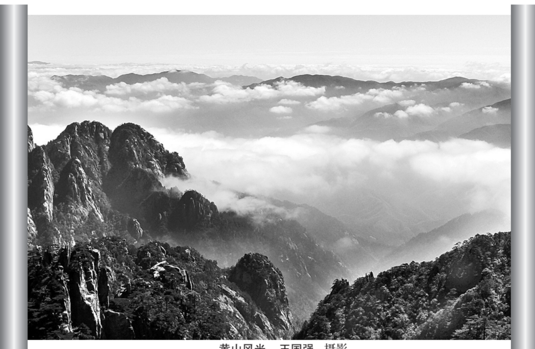
黄山风光

“千里稻花应秀色，五更梧桐更佳音”。它们漫天遍野地孕穗、灌浆、成熟，每一个步骤都轰轰烈烈，就这样一路走来，走到金色的秋天。此时，又到水稻黄熟的时节，我忍不住走出门去，走到稻子中间，就像走向我前生的姐妹之中，与稻、与山风耳鬓厮磨——山像个不会打扮的村姑，把一张脸画得五彩斑斓，这