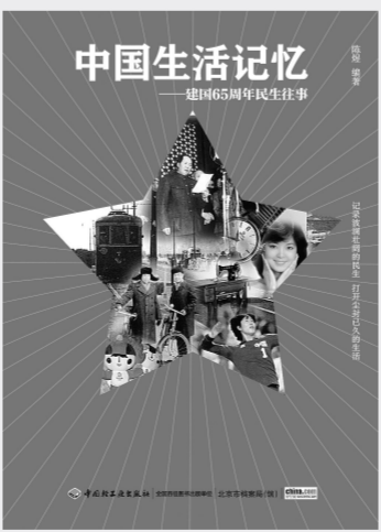
中国生活记忆 建国65周年民生往事

许多对加入WTO有疑虑的人高喊“狼来了”，要“与狼共舞”了。现在越来越多的人已经明白了，“与狼共舞”的关键，是善于合作，取得共赢。中国加入WTO五年过渡期结束后，到2006年年底，许多人已经感觉到生活改变了，看得见，摸得着的改变。