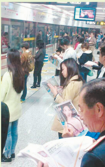
乘客在等地铁的间隙浏览《中原地铁报》

再过一周,郑州地铁1号线开通将满10个月。据市轨道公司运营分公司统计,目前地铁日均客流量已达17万人次,这个数字比开通前3个月日均客流量整整高出2万人。那么,每天在地铁上的时光该如何打发呢?