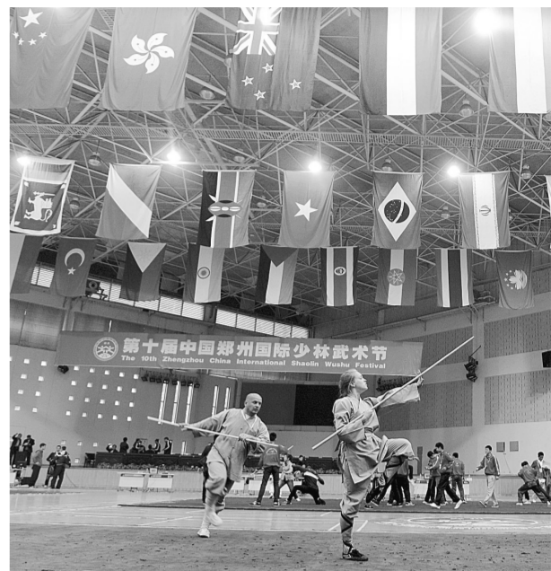
武术竞赛赛场。