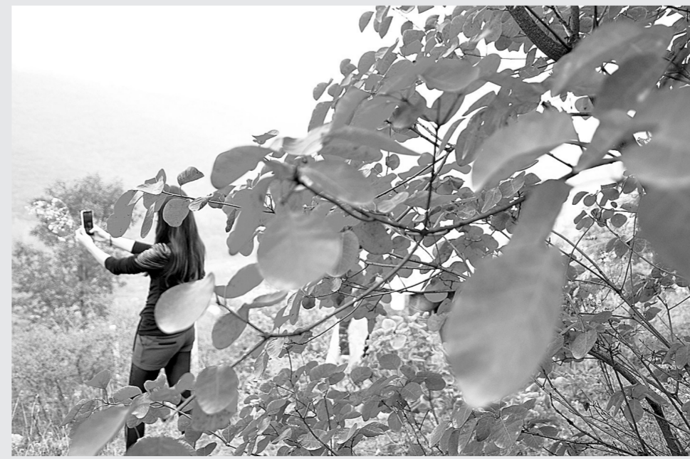
嵩山红叶节期间,游客在嵩山少室山红叶区观赏红叶。

本报讯(记者 李晓光 通讯员 刘少利 文图)金秋时节,嵩山层林尽染。昨日,记者从登封获悉:第五届嵩山红叶节将在10月26日拉开帷幕。 嵩山独特的地理环境和气候特征形成了以黄栌为主的大片红叶林带,观赏面积达20多平方公里,主要分布在少室山、太室山红叶区,品种丰富,色彩鲜艳,为中原地区最大、最佳的红叶观赏地,无论是在林带面积,红叶品种质地,还是在观赏时间,观赏环境都足以与北京香山红叶媲美。因此,旅游业内有着一“香山红叶,北方之最,嵩山红叶,中原最美”的赞誉。