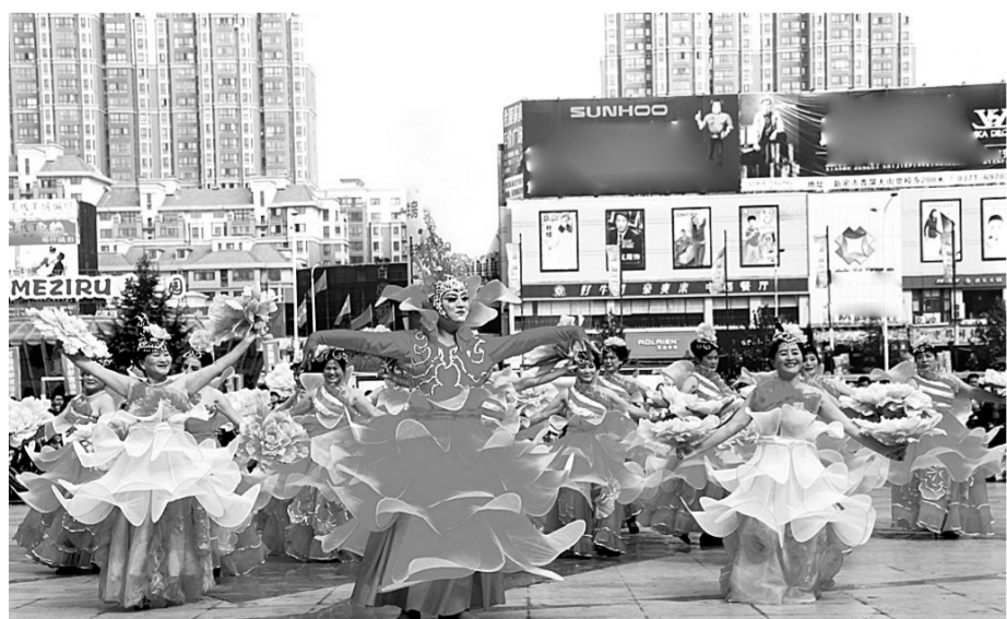
10月19日,新密市青屏广场热闹非凡,这里正在举行全民健身舞大赛。新密市各乡镇、局委、办事处25个代表队、500多位参赛选手参加了比赛,数千位市民现场观看了选手们的精彩表演。

大将周仓和关平。此刻康熙忽然明白,刚才救驾的不就是他们吗?原来是关公显灵啊。返京后,康熙就下令重修关公庙,并赐关公为关帝,还随旨发了御碑,寓意重视。 关帝庙,从宋代以后至明清曾多次重修,又多次遭战乱及黄河决口而毁坏。1992年,中牟县开发官渡古战场,将关帝庙作为一个景点进行重点开发重建,1995年移交官渡镇村委管理。2005年11月,官渡镇村委邀请释照见法师入住官渡寺,并于2006年4月,被国家宗教部门批准为对外开放合法的佛教活动场所。 如今的官渡寺,伴随着投入的不断加大,全仿古建筑林立,蔚为壮观。去年投资150万元建设山门一座,建成仿汉风格殿堂400平方米,建成后寺院占地面积30余亩。 “每逢初一、十五,这里香火鼎盛,人流如织。”梁福泉说,“官渡寺是有故事的,有底蕴的,我们要保护好它,开发好它,给予后代多留些念想……”