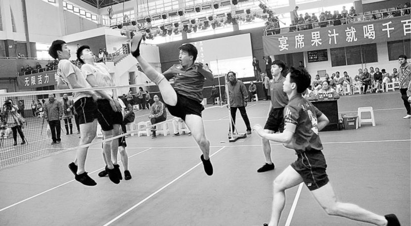
“郑州杯”全国毽球锦标赛现场，选手们正在进行激烈的比赛。

为纪念本次全国毽球锦标赛，大赛组委会特设计发行2014年“郑州杯”全国毽球锦标赛纪念封一枚。