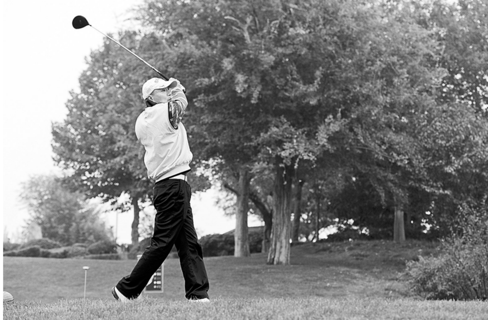
思念国际高尔夫学院成立仪式现场，一名学员正在挥杆练习。

本报讯(记者 陈凯 李焱)昨天上午，我省首家高尔夫学院河南思念国际高尔夫学院成立仪式在思念国际高尔夫俱乐部举行。未来，这家学院将成为我省培养青少年高尔夫选手的中坚力量。