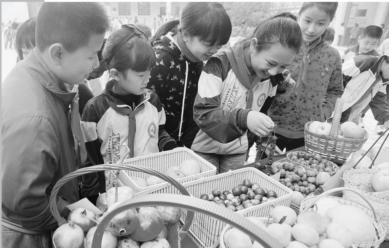
昨日,二七区幸福路小学举办“认识秋天”语文特别习作课展示活动。通过“果实展”,孩子们与秋天实物接触,共同感受秋之美。

本报讯(记者 汪辉 通讯员 秦川 王璞)昨日,记者从市卫生局获悉,郑州市第六人民医院(河南省传染病医院)顺利通过国家药物临床试验机构资格认定,是此次我省通过国家认定的唯一一家医疗机构。 国家食品药品监督管理局日前发布公告,批准认定全国51家医疗机构具有药物临床试验机构资格,郑州市第六人民医院艾滋病科、肝病科、结核病科、呼吸科、消化科、中西医结合艾滋病科、中西医结合肝病科7个科室获准开展药物临床试验。这意味着在该院就诊的患者将有接受最新治疗方案和免费治疗的机会。 作为我省唯一一所集医疗、科研、预防、教学、康复为一体的三级综合性传染病医院,郑州市第六人民医院致力于为全省传染病患者提供优质的医疗卫生服务,确立了“一专全能”传染病医院发展新模式。此次资格认定,将进一步推进医院医疗临床与科研的有机结合,进一步促进该院在传染病临床药物治疗研究上不断和国际接轨,最终遴选出更好、更有效的治疗药物造福患者。