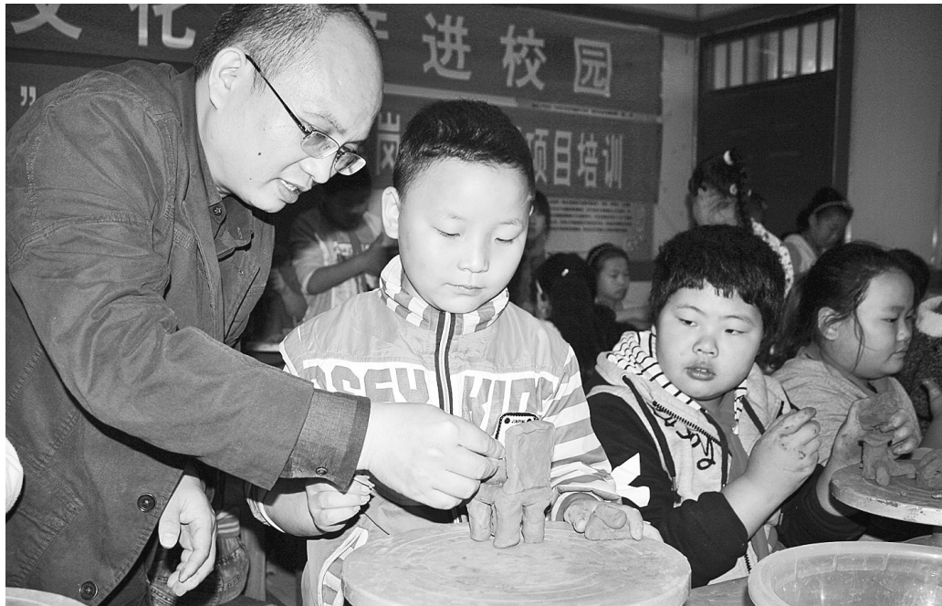
昨日,市群艺馆雕塑壁画院组织文化志愿者走进经开区营岗小学,开展泥塑艺术讲座和辅导活动,志愿者手把手教孩子们制作泥塑。

本次论坛预计将签约总投资5亿元以上的34个旅游项目,总投资606亿元,银旅合作签约项目26个,签约总金额115.6亿元。同时,还精心策划了包括以总投资350亿元的中原白沙湖文化休闲健康产业园项目、总投资50亿元的黄河小浪底旅游度假区建设项目等为代表的休闲度假产品,以总投资100亿元的卧龙岗文化旅游产业集聚区核心区整体项目等为代表的文化休闲产品,以总投资97亿元的商丘黄河故道生态文化旅游产业带项目等为代表的休闲农庄产品和以投资22亿元的洛阳丝绸之路伊洛风情街项目等为代表的特色街区旅游产品等50个针对性强、市场前景好的旅游招商项目,总投资1373亿元。