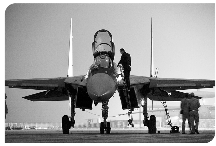
11月9日,已经抵达珠海金湾机场的运-20、歼-31、Su-35等本届航展上的明星机型依次进行了训练试飞,为即将开幕的第十届中国国际航空航天博览会热身。