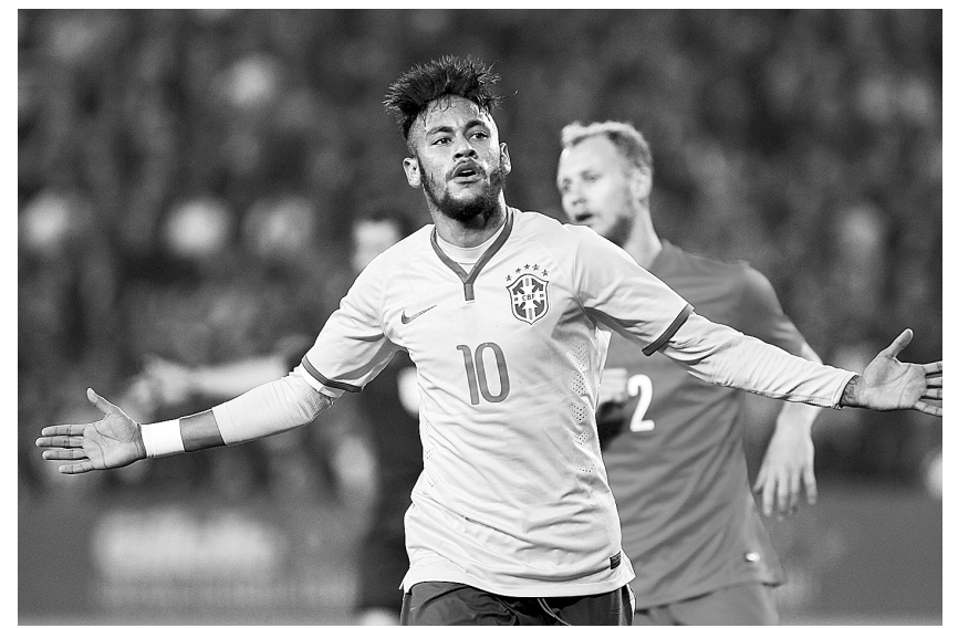
11月12日,巴西队球员内马尔庆祝进球。当日,在土耳其伊斯坦布尔举行的一场足球友谊赛中,巴西队以4:0战胜土耳其队。

哈德森说,他从中国队最近几场比赛的录像中发现,这是一个很有活力和冲劲的球队,估计14日晚新西兰队将面临一场艰难的比赛。而球队的前锋伍德则表示,他认为与中国队比赛将对备战俄罗斯世界杯预选赛起到很好的锻炼作用,不过这位在英超踢球的23岁小将表示,他并不认识中国队中像郑智和助教李铁这些以前曾在英超踢球的球员。