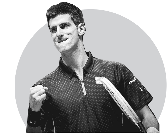
11月12日,焦科维奇在比赛中庆祝得分。当日,在伦敦进行的2014年ATP世界巡回赛年终总决赛小组赛中,塞尔维亚选手焦科维奇以2:0战胜瑞士选手瓦林卡。

据介绍,与新西兰男足国家队的国际足球赛将成为佩兰执掌国足帅印后进行的第八场热身赛。而历史上,国足与新西兰队一共进行过13场交锋,除了1982年世界杯预选赛期间的3场正赛,其余10场都是热身赛。在这13场比赛里,国足取得3胜4平6负的成绩。而在最近20多年间,国足对新西兰队保持不败。