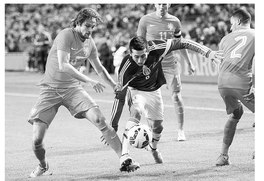
11月12日,荷兰队球员布林德(左)与墨西哥队球员埃雷拉(中)拼抢。当日,在荷兰阿姆斯特丹举行的友谊赛中,荷兰队以2:3不敌墨西哥队。