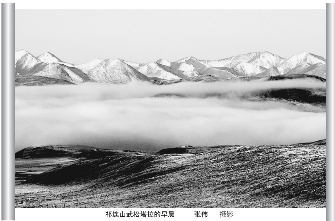
祁连山武松塔拉的早晨

清朝又将乌纱帽改为红缨帽，以帽顶所镶宝石和帽后翎枝区分官阶。一品官帽顶镶红宝石，二品珊瑚，三品蓝宝石，四品青晶石，五品水晶，六品碎碾，七品紫金顶，八品阴文镂花金顶，九品阳文镂花金顶。红缨帽顶珠下有翎管，质为玉或翡翠，用以安插翎枝。翎枝分蓝翎和花翎两种。蓝翎为鸂鶒羽所做，花翎即孔雀翎。花翎是清朝王公贵族特有的冠饰，有资格穿戴花翎的亲贵要在十岁时，经过必要的骑、射考试，合格后才能戴用。但后来花翎赏赐渐多，就不经过考试了。花翎又分单眼，双眼，三眼(“眼”指的是孔雀翎上的眼状的圆，一个圆圈算一眼)，有昭明等级、赏赐军功的作用。