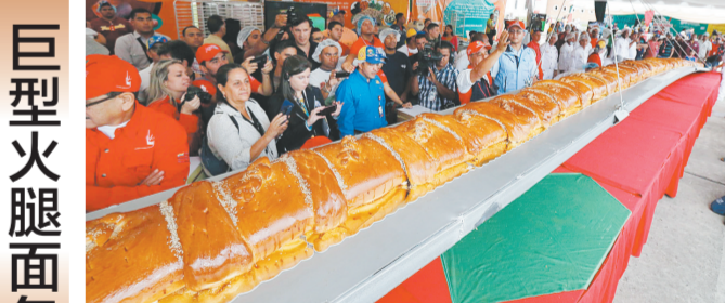
巨型火腿面包 11月15日,在委内瑞拉加拉加斯,厨师们制作出一条20米长的火腿面包,试图打破吉尼斯世界纪录。火腿面包是委内瑞拉人圣诞节的一道传统菜肴。图为工作人员给20米长的火腿面包称重。

油价和运输费用下降,能推动外地蔬菜等农产品价格的下跌幅吗? 至少从北京市场来看,希望恐怕要落空。“油价下跌对于外地菜进京的价格影响非常小。”北京新发地统计部负责人刘通介绍说,蔬菜运输成本由三个部分组成:一是车辆磨损费和人工工资,二是通行费用,三是油费。但是,油费只占到整个成本的三分之一。如果按照这一比例计算,“八连跌”后柴油价格下跌约七分之一,只能推动整体蔬菜运输成本下降约5%。 新华社北京11月16日电