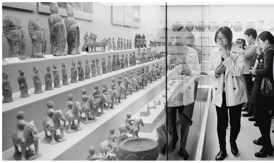
11月19日,“南水北调中线工程河南段文物保护成果展”在河南省安阳市博物馆开展,共展出该项工程河南省境内沿线8个城市选送的珍贵文物3000余件,展示了河南省在南水北调工程建设中文物保护、研究和保护的突出成果。