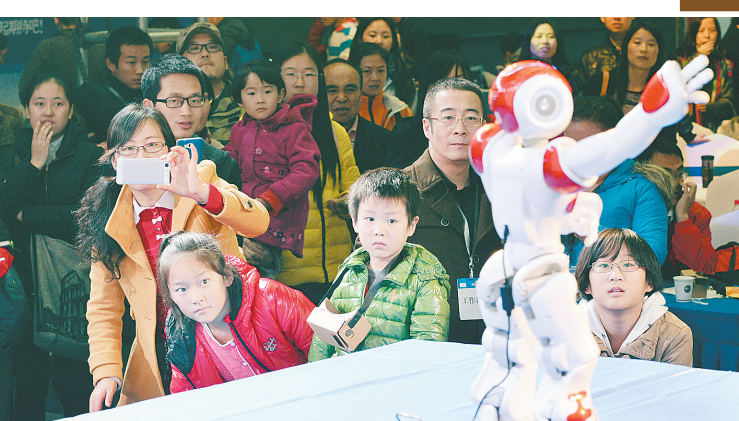
11月22日,多位少儿科技爱好者和父母参加了2014全球创业周西安站青少年创客课堂活动。图为孩子们在观看机器人表演。