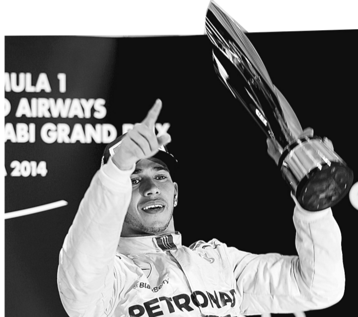
11月23日,梅赛德斯车队英国车手汉密尔顿在颁奖仪式上庆祝。当日,在世界一级方程式赛车锦标赛(F1)收官之战——阿布扎比站的正赛中,汉密尔顿以1小时39分02秒619的成绩夺得冠军并加冕车手总冠军。

反兴奋剂中心同时公布了第二和第三季度的检查数据。由于今年大赛频繁而且恰逢省运会年,中心在这两个季度进行了大约9900例兴奋剂检查。