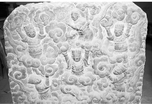
庙院内的石碑雕刻见证了百年前高超工艺。