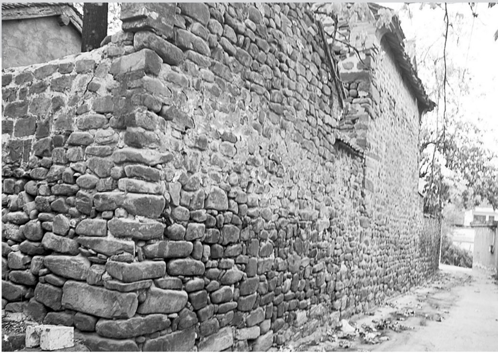
全部用石头砌成的房屋是石洞沟村的最大特色。

说起村子的集会,不能不提到的就是村子里的庙会,而现在庙院仅存的两座庙祠就是天爷庙和猴王庙,庙里分别供奉了玉皇大帝、齐天大圣。这两座庙只是庙院的很小一部分,原本这里是古庙群,大小庙宇多达数十座,村民称为庙院,庙院坐东向西,占地约十二亩。如今,村民自发建立同乐协会,每逢春节,便会在村委的扶持下,组织舞龙、舞狮、盘鼓等文艺娱乐活动,参加文艺汇演的,年年有奖,以继承保存各种文化活动的技能,避免失传。