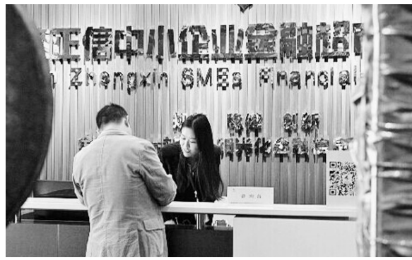
客户正在咨询业务