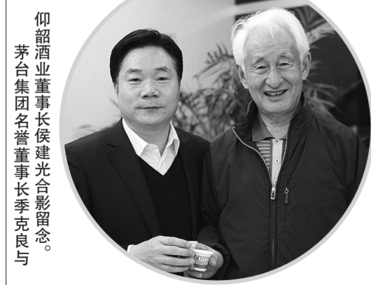
仰韶酒业董事长侯建光合影留恋。 茅台集团名誉董事长季克良(右三)在仰韶酒业办公室合影留恋。

12月5日,贵州茅台集团名誉董事长、技术总顾问季克良在河南首站莅临仰韶酒业进行调研指导工作。这是继今年11月中国著名白酒专家、中国酒业协会专家组成员梁邦昌来仰韶调研指导之后的第二家国家级白酒专家。据悉,季老此次河南之行,行程安排的非常紧张,首站在仰韶酒业调研之后,还将去宋河等豫酒企业调研指导。