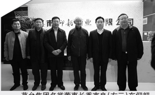
茅台集团名誉董事长季克良(右三)在仰韶酒业办公室合影留恋。

国酒业引领世界消费而持续努力,使仰韶文化成为影响人类文明的伟大智慧。同时,以此为契机不断加强管理,进一步健全产品质量控制和追溯体系,大力推进标准化生产,着力提升产品质量,强化品牌意识,塑造品牌形象,提高产品的综合生产能力、可持续发展能力和市场竞争力。