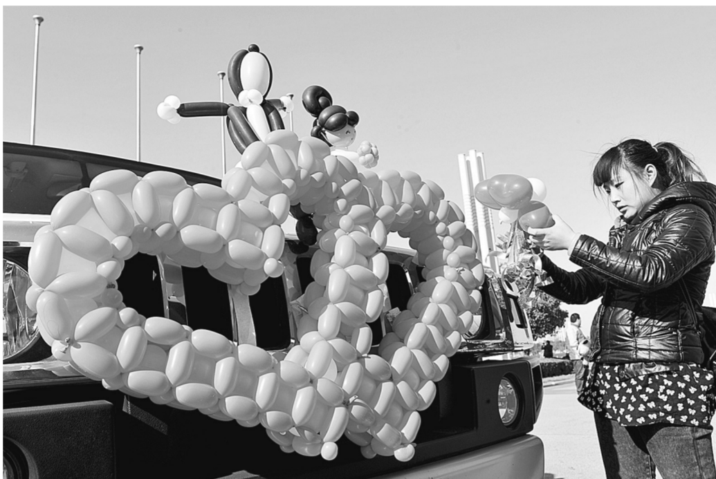
来自全国各地的45名插花选手日前相聚郑东新区如意湖畔,参加郑州首届创意花车插花大赛。参赛者采用花卉、水果、气球等材料,将一辆辆婚礼花车装扮得格外靓丽。大赛评出4个金奖、8个银奖。

新政提出,我省要建立开放的高校科技评价机制。对基础研究人才,要大力加强国际同行评价;对从事应用研究人才,要引入用户、市场和专家等相关第三方参与评价;对从事技术转移人员,要引入市场要素评价。