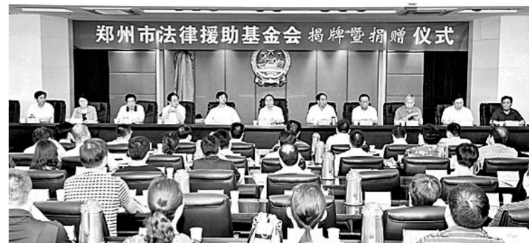
郑州市法律援助基金会揭牌暨捐赠仪式。

2014年郑州市法律援助基金会和郑州市法律援助中心联合下文：“法律援助志愿者三年行动计划”正式启动。郑州市辖区内各县(市、区)司法局和法律援助中心的领导高度重视，积极组织配合。参与“法律援助志愿者三年行动计划”的20名法律援助志愿者以极大的热情投入到这项工作中。法律援助工作全面展开，20个乡镇法律援助基金会法律援助办公室，得到了当地群众的广泛欢迎和认可，正在形成依法解决矛盾纠纷的良好氛围和环境，得到了当地政府和群众的赞扬。