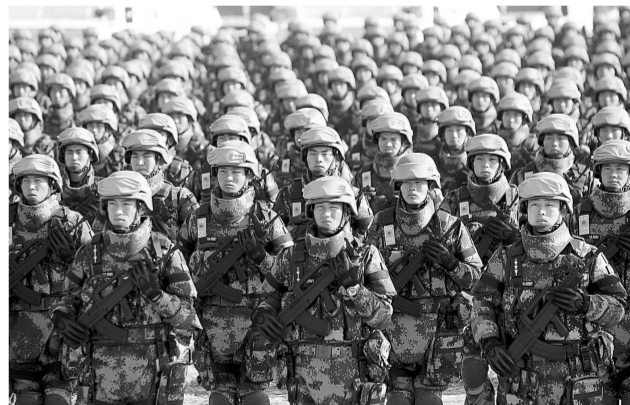
22日，中国首支维和步兵营在山东举行出征誓师大会，这是我国首次派遣步兵营执行国际维和任务。

2015年5月9日是俄罗斯卫国战争胜利70周年纪念日，俄罗斯政府计划邀请世界多国领导人赴俄出席相关纪念活动。届时，俄罗斯会在全国范围内举行阅兵、游行等庆祝活动。