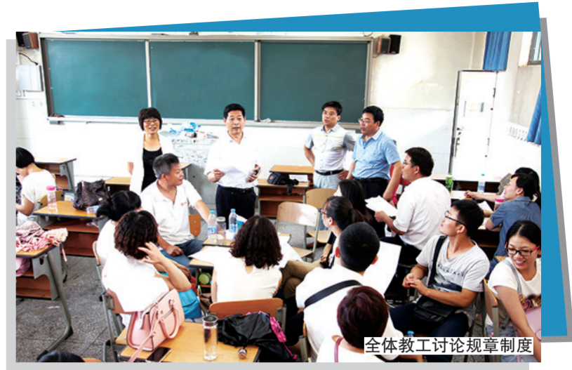
全体教工讨论规章制度