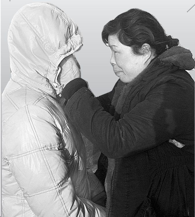
妈妈一边鼓励大女儿要坚强,一边抹去她的眼泪。