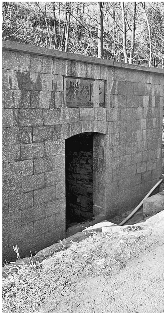
搬倒井美名远播,近观却其貌不扬。

登封多山,有山则灵。层峦叠嶂处,祖祖辈辈生活在这里的百姓,不仅用自己勤劳的双手顽强生存着,更用脍炙人口的传说赋予大山美丽的外衣。