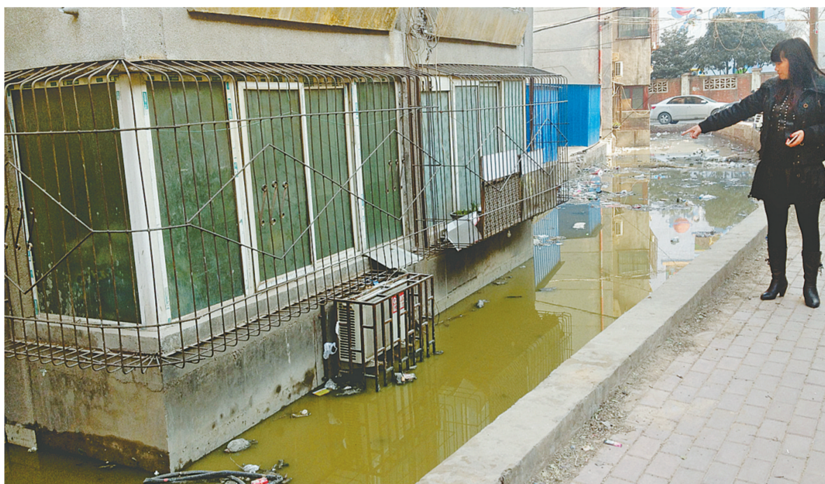
居民看着污水沟满是无奈。

“居民最先找过小区物业反映情况,但问题始终未能得到有效解决,至今排污口仍在不停往沟里排放污水。”在附近巡逻的巡防队员表示,希望相关部门能划清责任,加紧抢修地下管道,尽快堵塞排污口,还小区居民一个优良的居住环境。