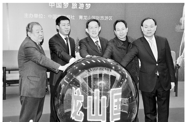
与会嘉宾共同开启青龙山旅游战略发布会。

本报讯(记者 刘文良 文 侯国昌 图)10日，“青龙山旅游战略发布会暨中部旅游文化产业创新发展论坛”在北京人民大会堂河南厅举办。 中原经济区、郑州航空港经济综合实验区蓝图绘就，我省文化旅游产业迎来了全新发展机遇。河南共生集团拟投资80多亿元，将大自然的鬼斧神工，融合英国Haskoll与美国阿特金斯的规划设计，将青龙山打造为国际文化旅游综合体，同时，也是我省首个文化旅游聚集区。为了深度探讨与交流在新常态下我国旅游产业跨界融合、创新发展的新趋势、新态势，共话青龙山旅游战略，中国旅游报、河南共生集团联合举办了此次发布会和论坛。 国家旅游局原副局长程文栋、著名文化学者王立群、中国旅游报社社长高舜礼、中国社会科学院旅游研究中心副主任戴学锋、河南省旅游协会秘书长周学海、美国菲科力斯猫画原创公司中国区董事长陈军、欧易姆奥特莱斯(中国)董事长徐洪双等众多文化旅游行业领导及专家出席。 作为此次发布会和论坛的举办方之一，河南共生集团董事长王凤桐从旅游规划、旅游模式及旅游特色等方面对青龙山旅游战略进行了详细阐述。集团在先后考察16个国家的多个著名景区景点之后，在充分尊重青龙山生态原貌的基础上，着力打造世界度假地、青龙山旅游度假区、天真谷养生地三大项目，创新融合旅游观光、文化体验、休闲度假、梦幻游乐、山地运动、养生养老、医疗科研八大功能，推出81项文化旅游项目，打造名副其实的“国际文化旅游综合体”。 本次活动得到了人民日报、新华社、中央电视台、中国旅游报、人民网、新华网、凤凰网、中国网、百度、新浪、搜狐和省内媒体等50多家主流媒体的关注。